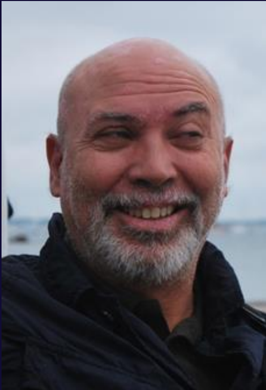
Regista Maurizio Canovaro

La Commissione artistica sarà composta da professionisti del settore – direttore d'orchestra, regista, docenti di canto e rappresentanti del Teatro dell'Aglio – il cui giudizio è insindacabile .